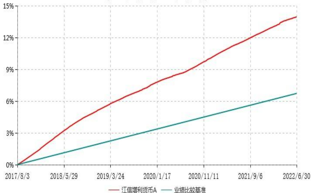
江信增利货币A累计净值收益率与业绩比较基准收益率历史走势对比图 (2017年08月03日-2022年06月30日)