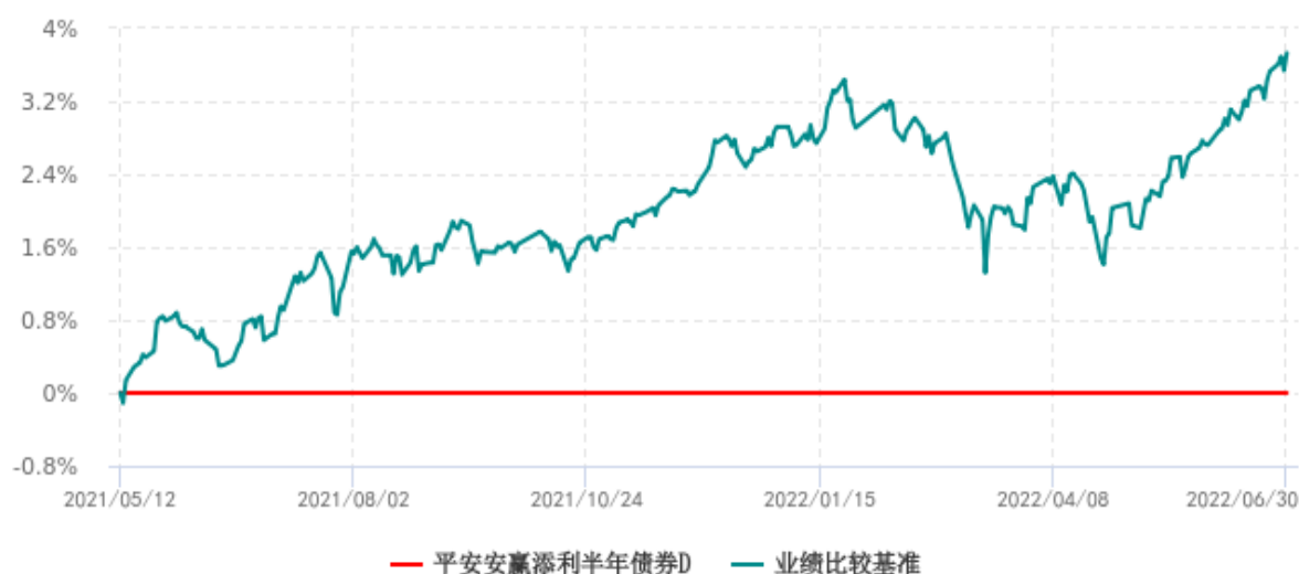
平安安赢添利半年债券D累计净值增长率与业绩比较基准收益率历史走势对比图 (2021年05月12日-2022年06月30日)