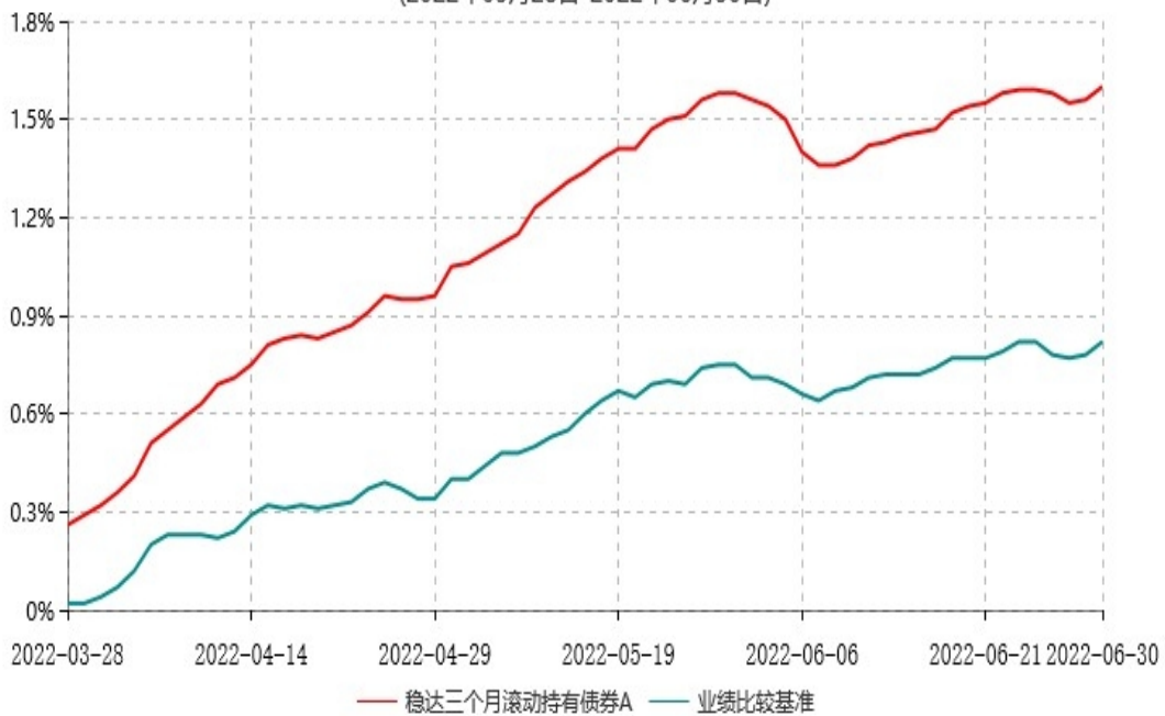
稳达三个月滚动持有债券A累计净值增长率与业绩比较基准收益率历史走势对比图 (2022年03月28日-2022年06月30日)