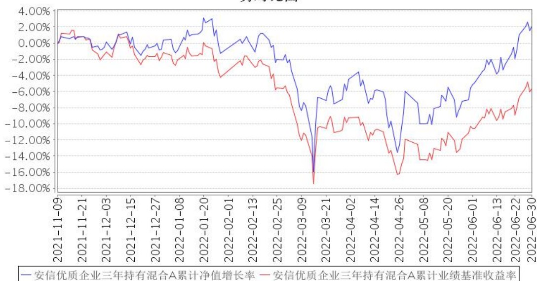
安信优质企业三年持有混合A累计净值增长率与同期业绩比较基准收益率的历史走势对比图