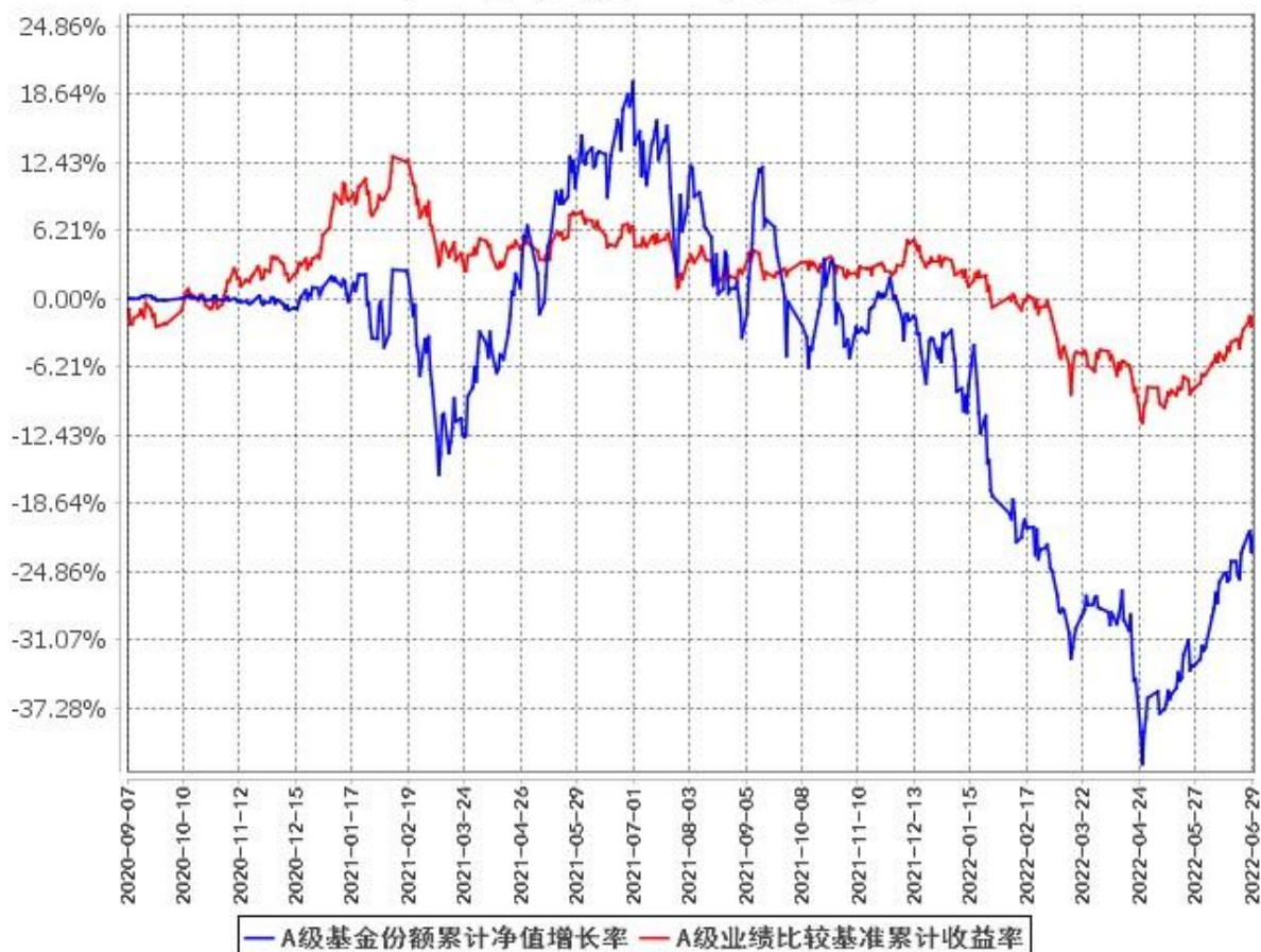
A级基金份额累计净值增长率与同期业绩比较基准收益率的历史走势对比图 (2020年9月7日至2022年6月30日)