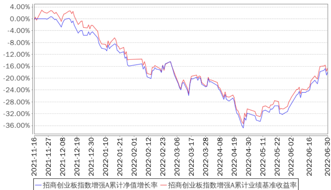
招商创业板指数增强A累计净值增长率与同期业绩比较基准收益率的历史走势对比图