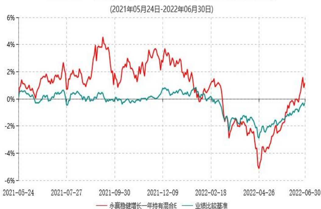
永赢稳健增长一年持有混合E累计净值增长率与业绩比较基准收益率历史走势对比图