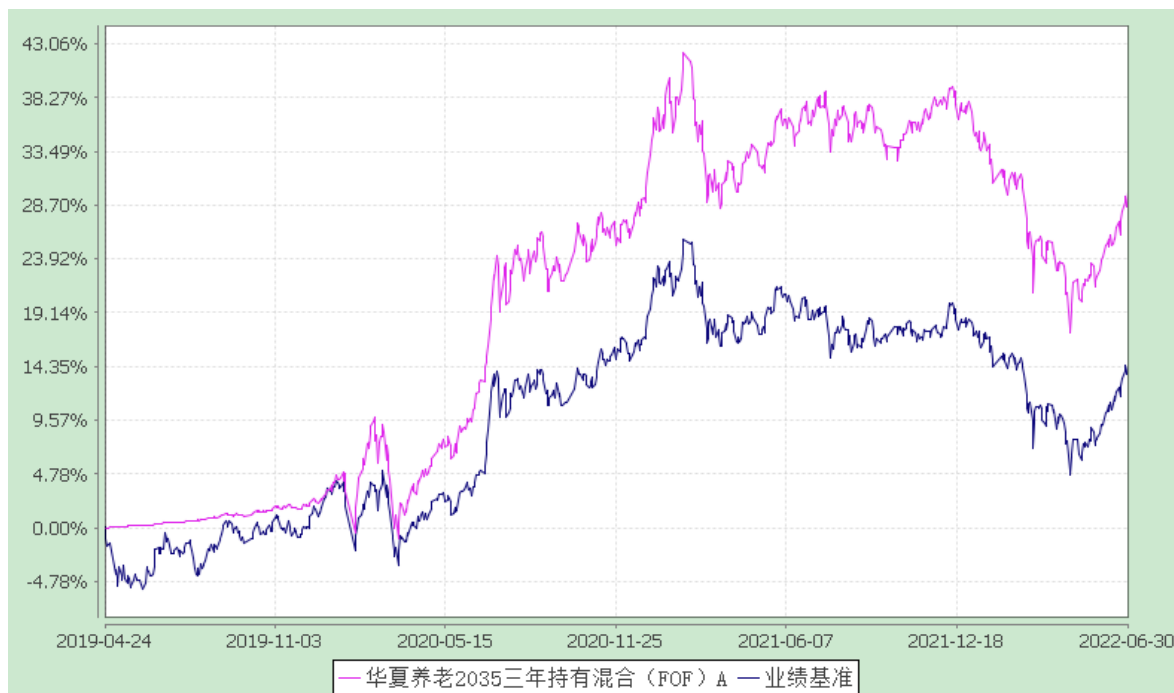
华夏养老 2035 三年持有混合（FOF）C: