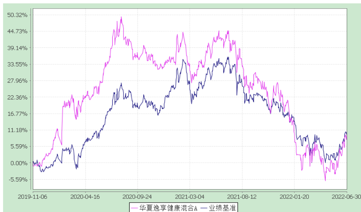
华夏逸享健康混合 C: