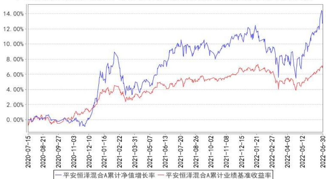
平安恒泽混合A累计净值增长率与同期业绩比较基准收益率的历史走势对比图