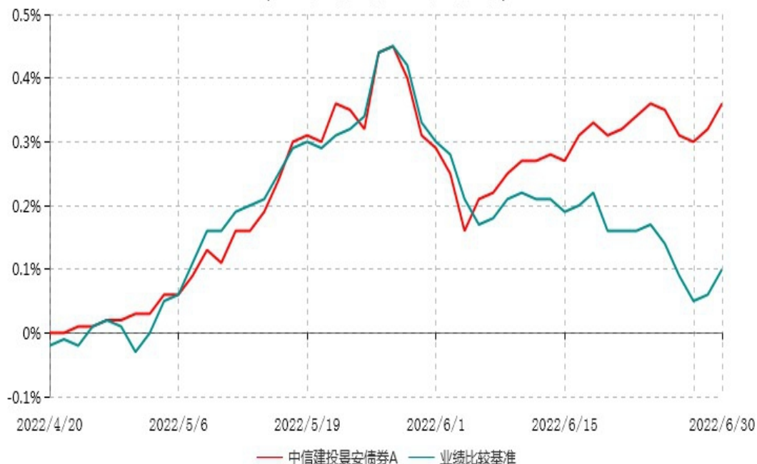
中信建投景安债券A累计净值增长率与业绩比较基准收益率历史走势对比图 (2022年04月20日-2022年06月30日)