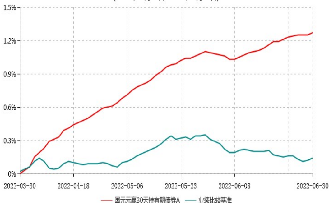
国元元赢30天持有期债券A累计净值增长率与业绩比较基准收益率历史走势对比图 (2022年03月30日-2022年06月30日)