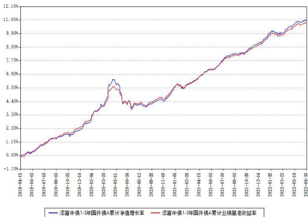
添富中债1-3年国开债A累计净值增长率与同期业绩基准收益率对比图