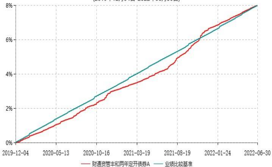
财通资管丰和两年定开债券A累计净值增长率与业绩比较基准收益率历史走势对比图 (2019年12月04日-2022年06月30日)