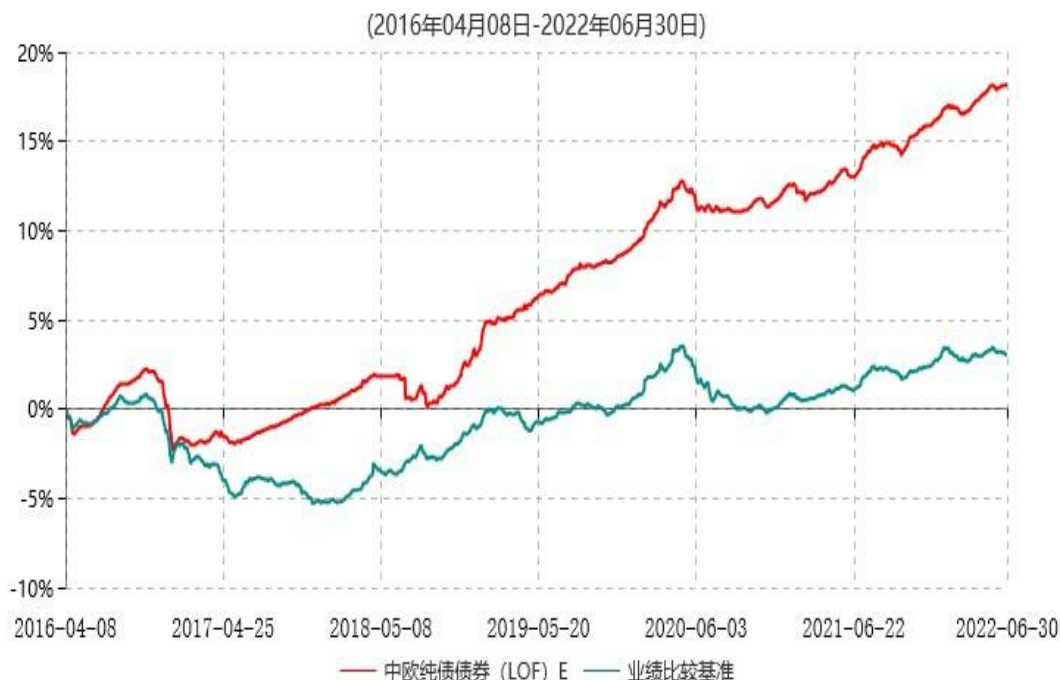
中欧纯债债券 (LOF) E 累计净值增长率与业绩比较基准收益率历史走势对比图

注：自 2016 年 4 月 6 日起，本基金新增 E 类份额，图示日期为 2016 年 4 月 8 日至 2022 年 06 月 30 日。