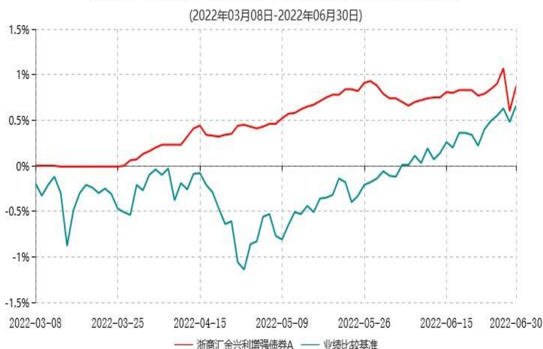
浙商汇金兴利增强债券A累计净值增长率与业绩比较基准收益率历史走势对比图

注：本基金合同生效日为 2022 年 3 月 8 日，自基金合同生效日起至本报告期末不满一年。至本报告期末，本基金尚未完成建仓。