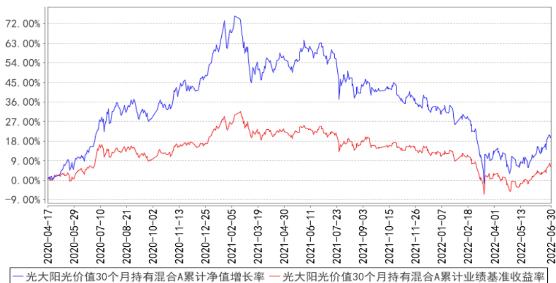
光大阳光价值30个月持有混合A累计净值增长率与同期业绩比较基准收益率的历史走势对比图