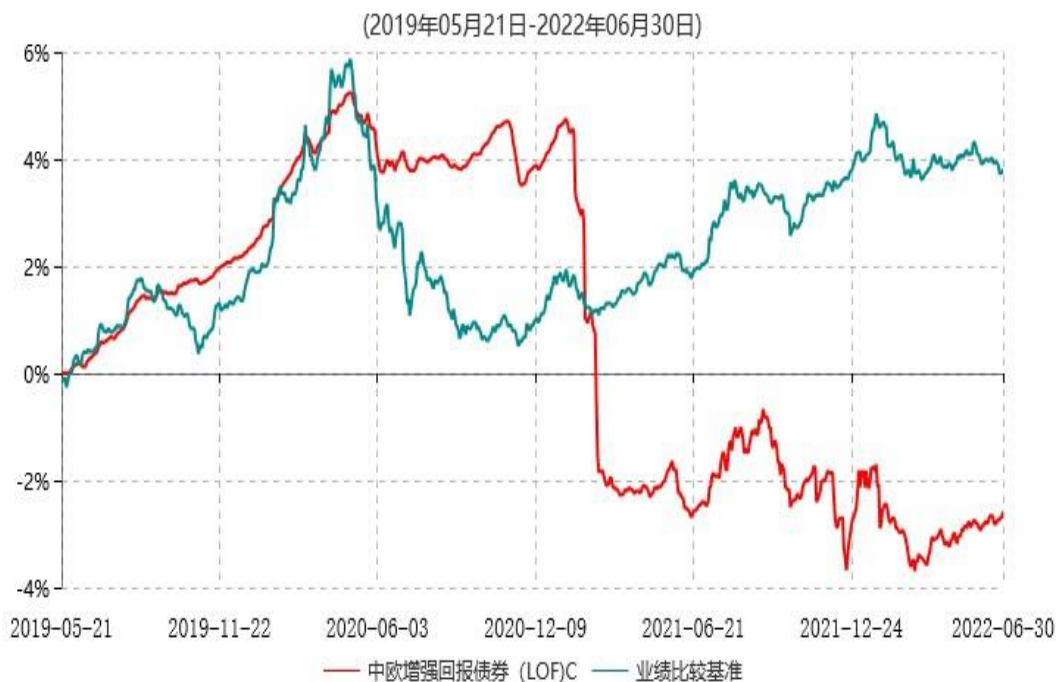
中欧增强回报债券 (LOF)C 累计净值增长率与业绩比较基准收益率历史走势对比图

注：本基金于 2019 年 5 月 20 日新增 C 份额，图示日期为 2019 年 5 月 21 日至 2022 年 06 月 30 日。