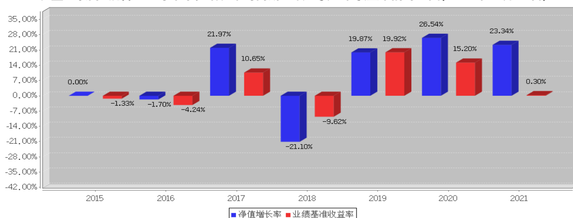
长盛互联网+混合基金每年净值增长率与同期业绩比较基准收益率的对比图(2021年12月31日)