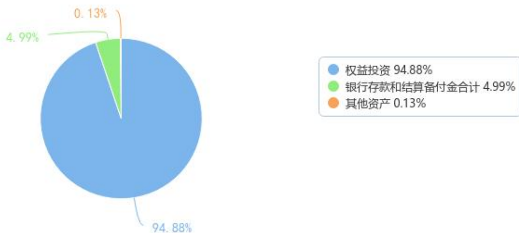
投资组合资产配置图表（数据截至日期：2022年06月30日）

注：投资组合资产配置图表/区域配置图表数据截止日期 2022 年 6 月 30 日。