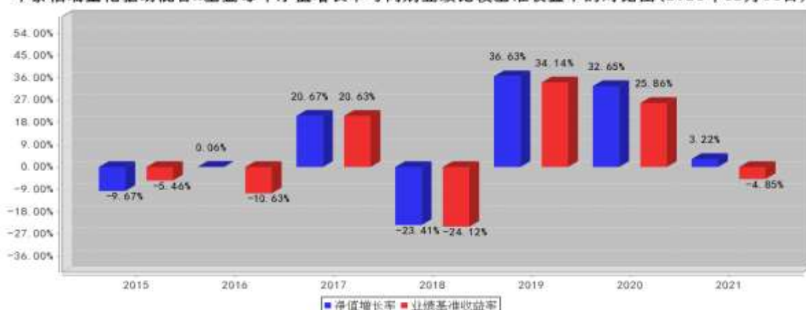
华泰柏瑞量化驱动混合A基金每年净值增长率与同期业绩比较基准收益率的对比图(2021年12月31日)

注:业绩表现截止日期 2021 年 12 月 31 日。基金过往业绩不代表未来表现。