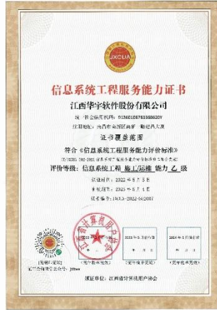
荣获信息系统工程服务能力乙级证书