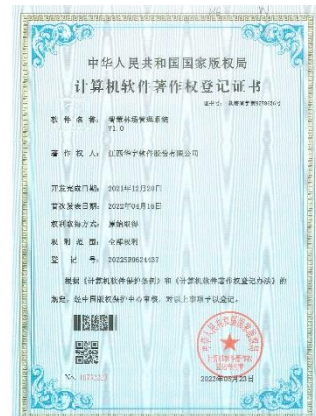
获得得三项软件著作权证书