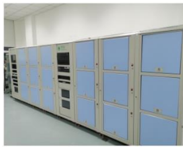
宽带电力载波通信检测系统