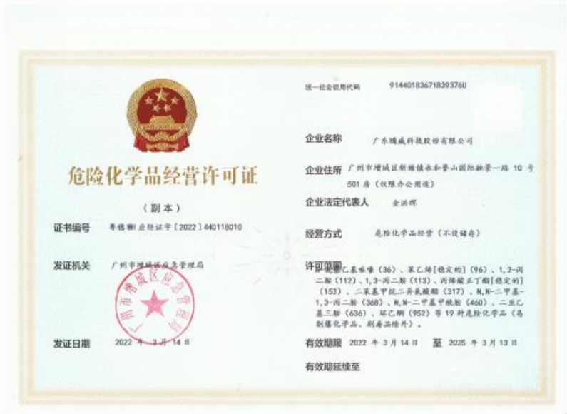
广东腾威科技股份有限公司于 2022 年 3 月 14 日取得危险化学品经营许可证