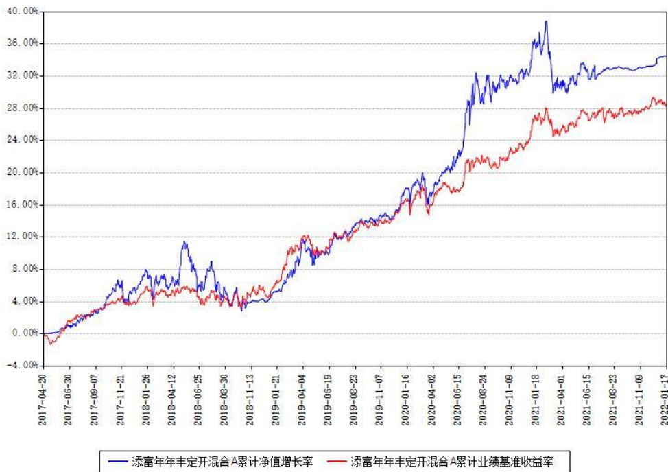
添富年年丰定开混合A累计净值增长率与同期业绩基准收益率对比图