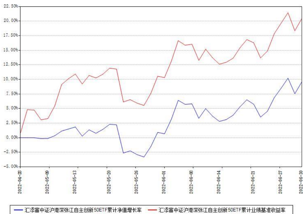
汇添富中证沪港深张江自主创新50ETF累计净值增长率与同期业绩基准收益率对比图

(二) 自基金合同生效以来基金累计净值增长率变动及其与同期业绩比较基准收益率变动的比较图