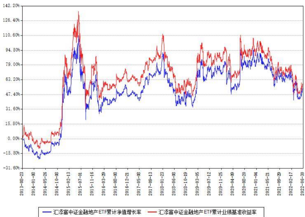
汇添富中证金融地产ETF累计净值增长率与同期业绩基准收益率对比图