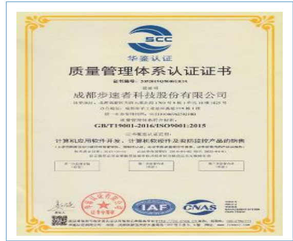
2022年3月，公司通过IOS09001质量管理体系认证