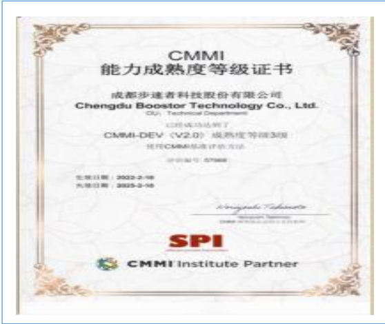
2022年2月，公司连续4次通过CMMI3认证