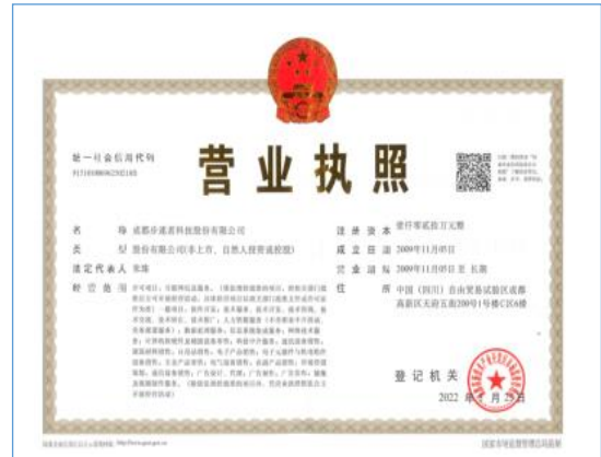
2022年5月，公司变更经营范围并取得变更后的《营业执照》