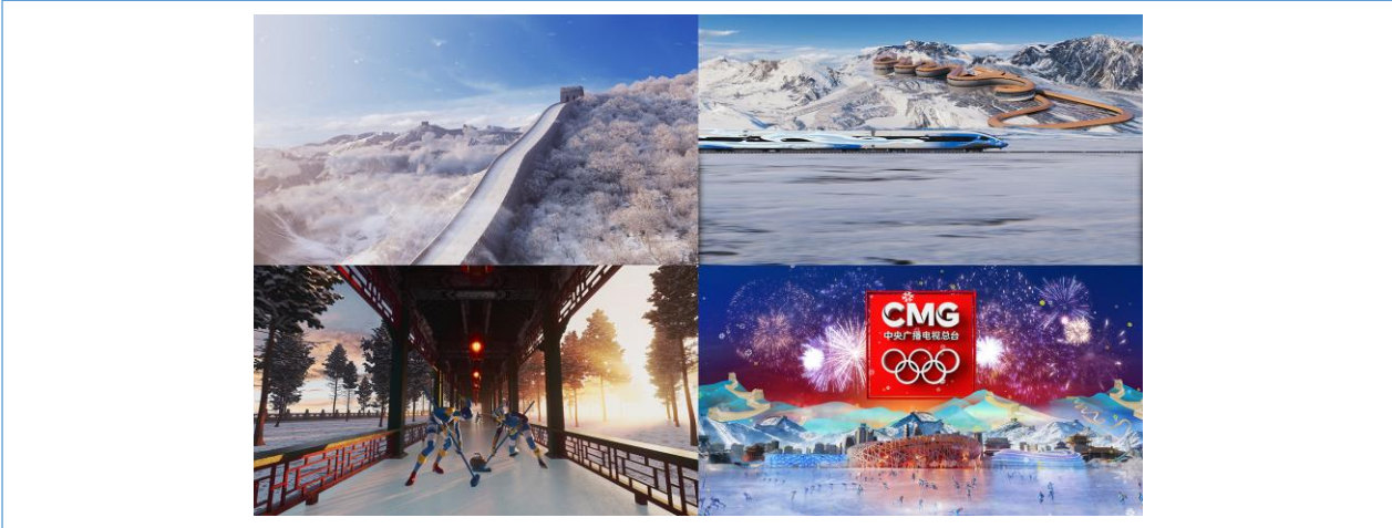
北京 2022 冬奥会项目