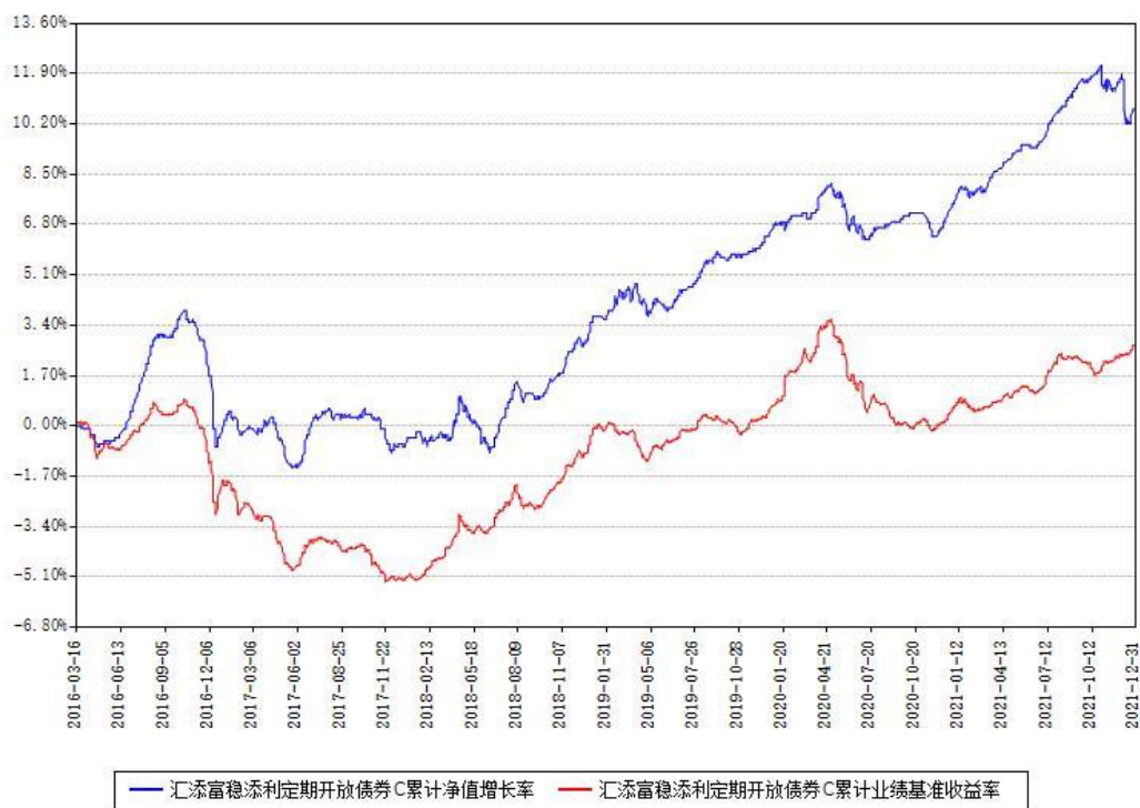
汇添富稳健添利定期开放债券C累计净值增长率与同期业绩基准收益率对比图