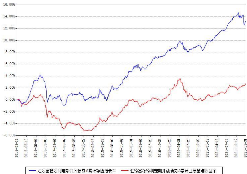
汇添富稳健添利定期开放债券A累计净值增长率与同期业绩基准收益率对比图