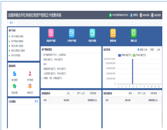
为全国供销合作总社研制社有资产建档立卡信息管理系统