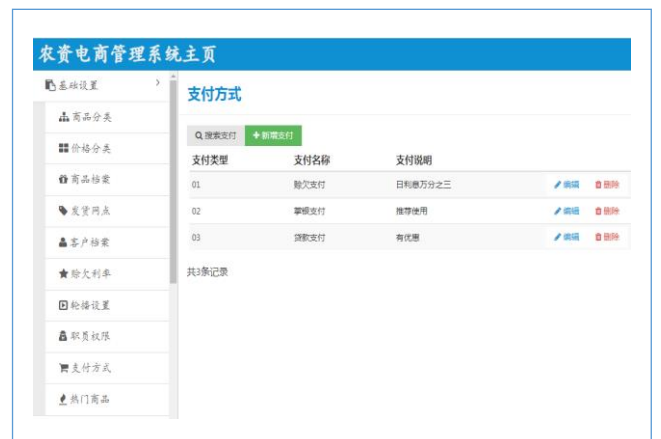
推动农资供应链平台与江苏省农行掌银数据链接，为种植大户、农民专业合作社购买农资商品供更便捷优惠的金融服务