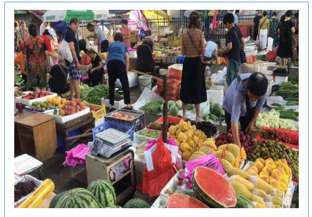
湖南子公司被衡阳市商务和粮食局列入“衡阳市生活必需品应急保供骨干企业”，抗疫助农、稳价保供两不误