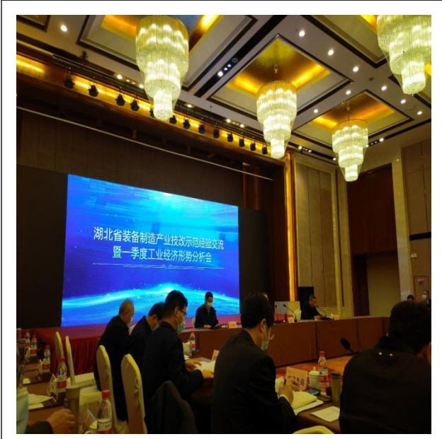
2022年3月，公司受邀参加湖北省经济工作会议