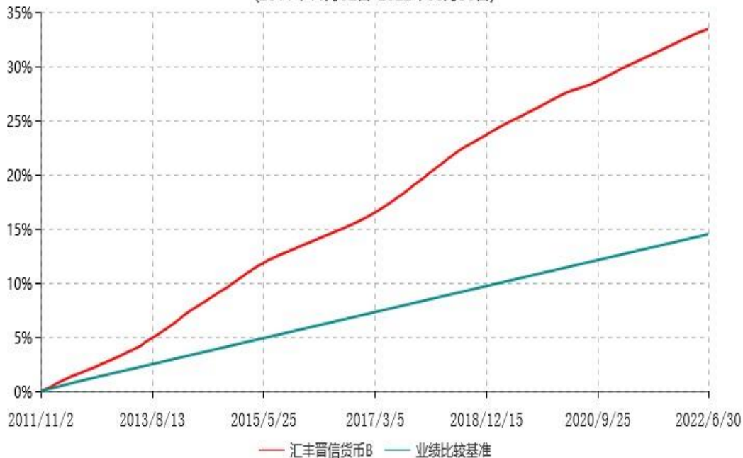
汇丰晋信货币B累计净值收益率与业绩比较基准收益率历史走势对比图 (2011年11月02日-2022年06月30日)