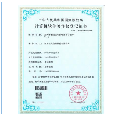
2022 年上半年公司共申请获得计算机软件著作权登记证书 15 项