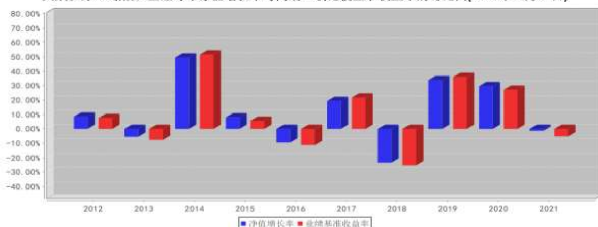
大成沪深300指数A基金每年净值增长率与同期业绩比较基准收益率的对比图(2021年12月31日)