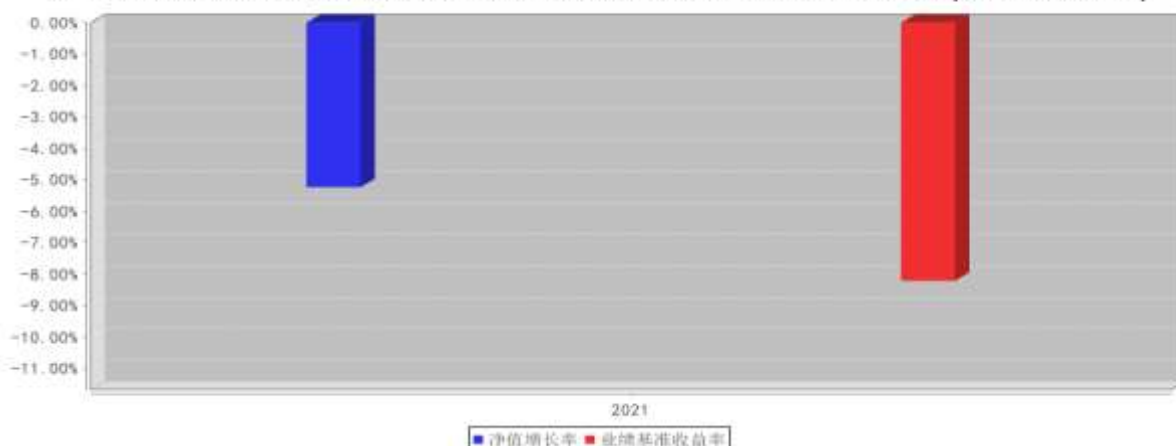
大成企业能力驱动混合C基金每年净值增长率与同期业绩比较基准收益率的对比图(2021年12月31日)