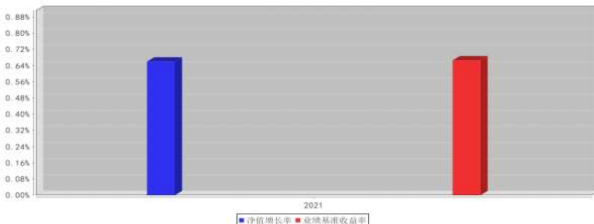
大成恒享夏盛一年定开混合C基金每年净值增长率与同期业绩比较基准收益率的对比图(2021年12月31日)