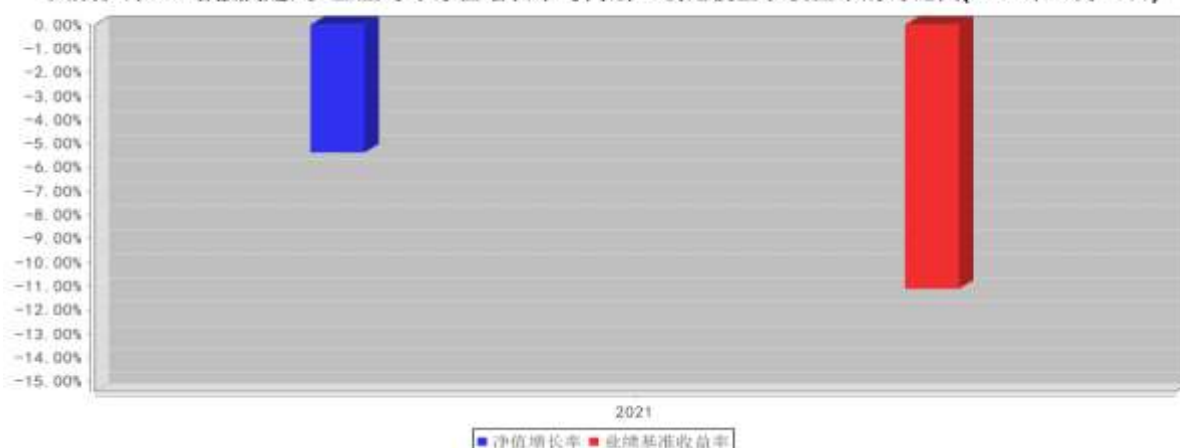
大成沪深300增强发起式C基金每年净值增长率与同期业绩比较基准收益率的对比图(2021年12月31日)

注:1、基金的过往业绩不代表未来表现。2、如合同生效当年不满完整自然年度的,按实际期限计算净值增长率。