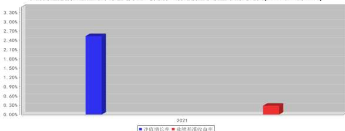
大成景盈债券C基金每年净值增长率与同期业绩比较基准收益率的对比图(2021年12月31日)