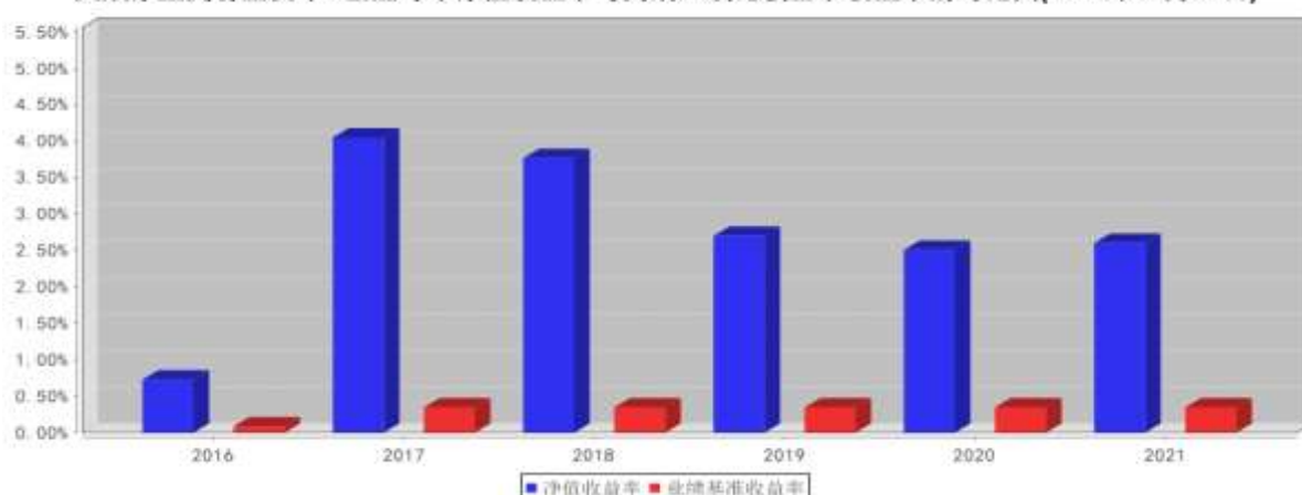
大成添益交易型货币B基金每年净值收益率与同期业绩比较基准收益率的对比图(2021年12月31日)

注:1、基金的过往业绩不代表未来表现。 2、如合同生效当年不满完整自然年度的,按实际期限计算净值增长率。