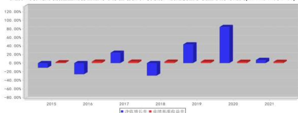
大成正向回报灵活配置混合基金每年净值增长率与同期业绩比较基准收益率的对比图(2021年12月31日)

注:1、基金的过往业绩不代表未来表现。 2、如合同生效当年不满完整自然年度的,按实际期限计算净值增长率。