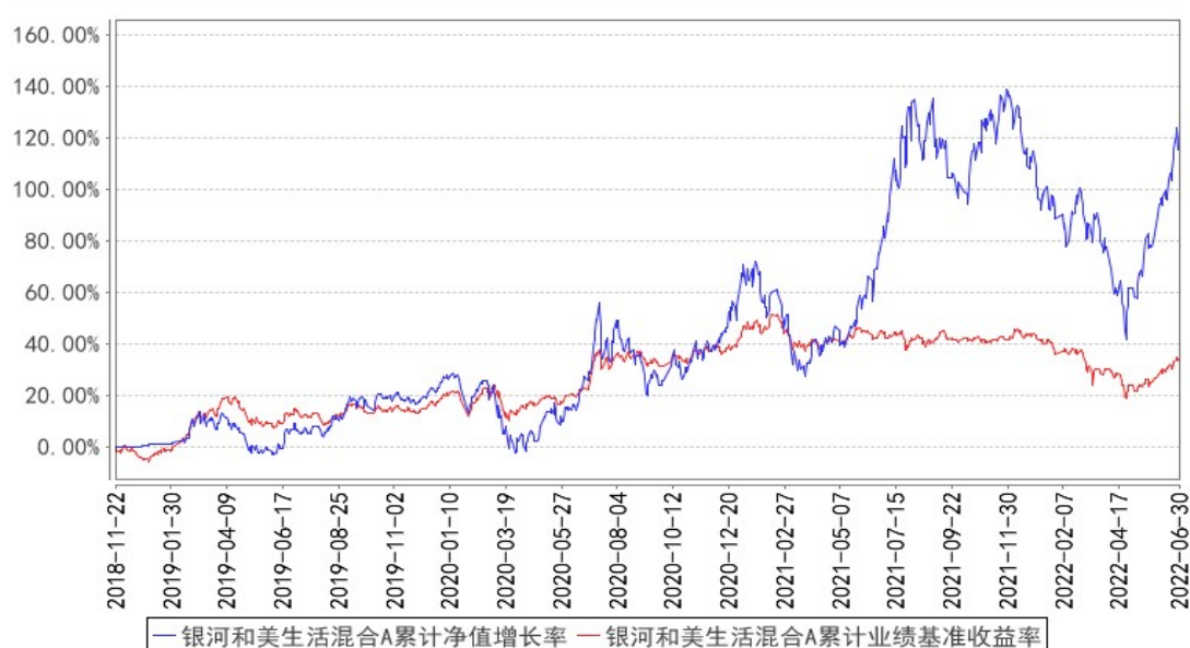
银河和美生活混合A累计净值增长率与同期业绩比较基准收益率的历史走势对比图