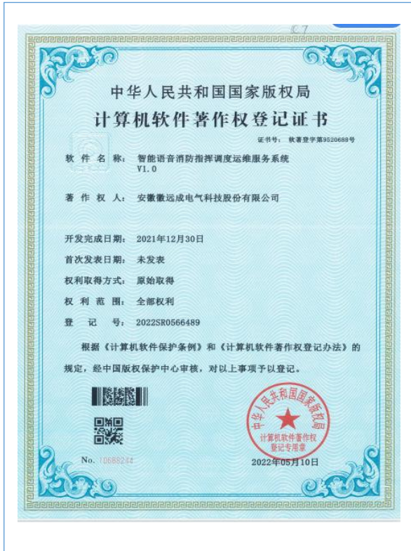
智能语音消防指挥调度运维服务系统 V1.0