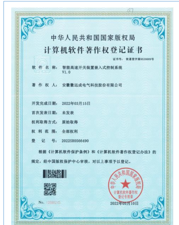
智能高速开关装置嵌入式控制系统 V1.0