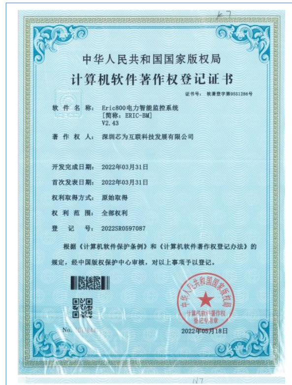
Eric800 电力智能监控系统【简称：ERIC-BM】 V2.43