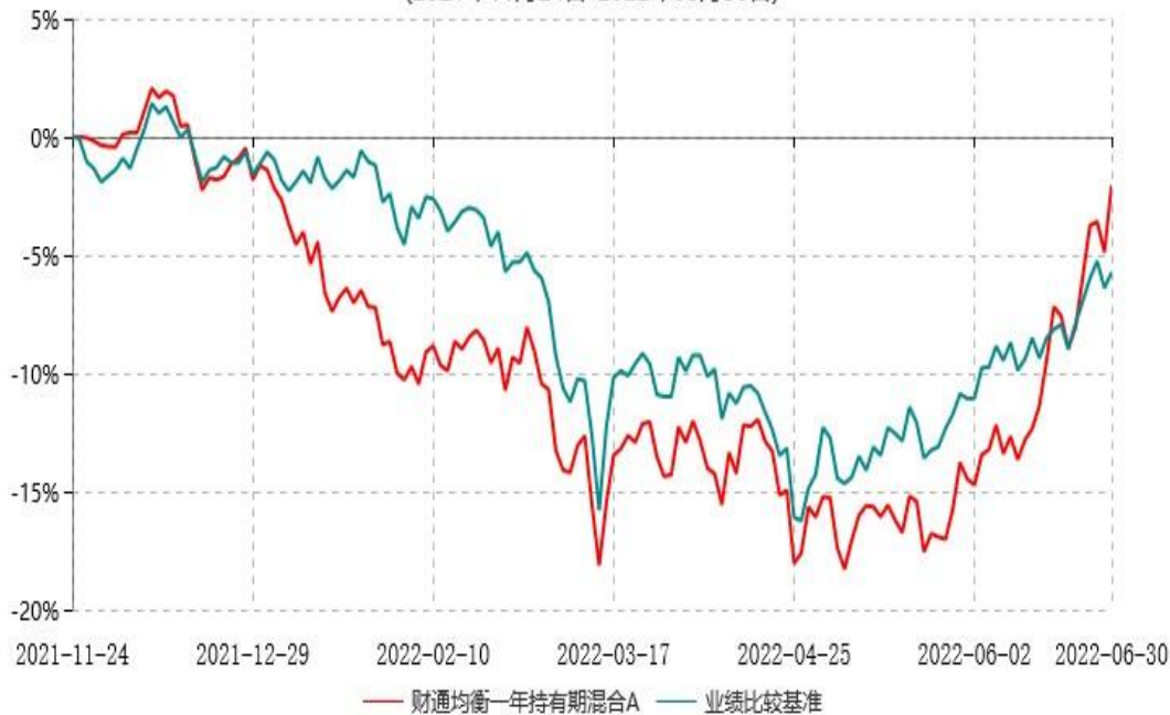
财通均衡一年持有期混合A累计净值增长率与业绩比较基准收益率历史走势对比图 (2021年11月24日-2022年06月30日)