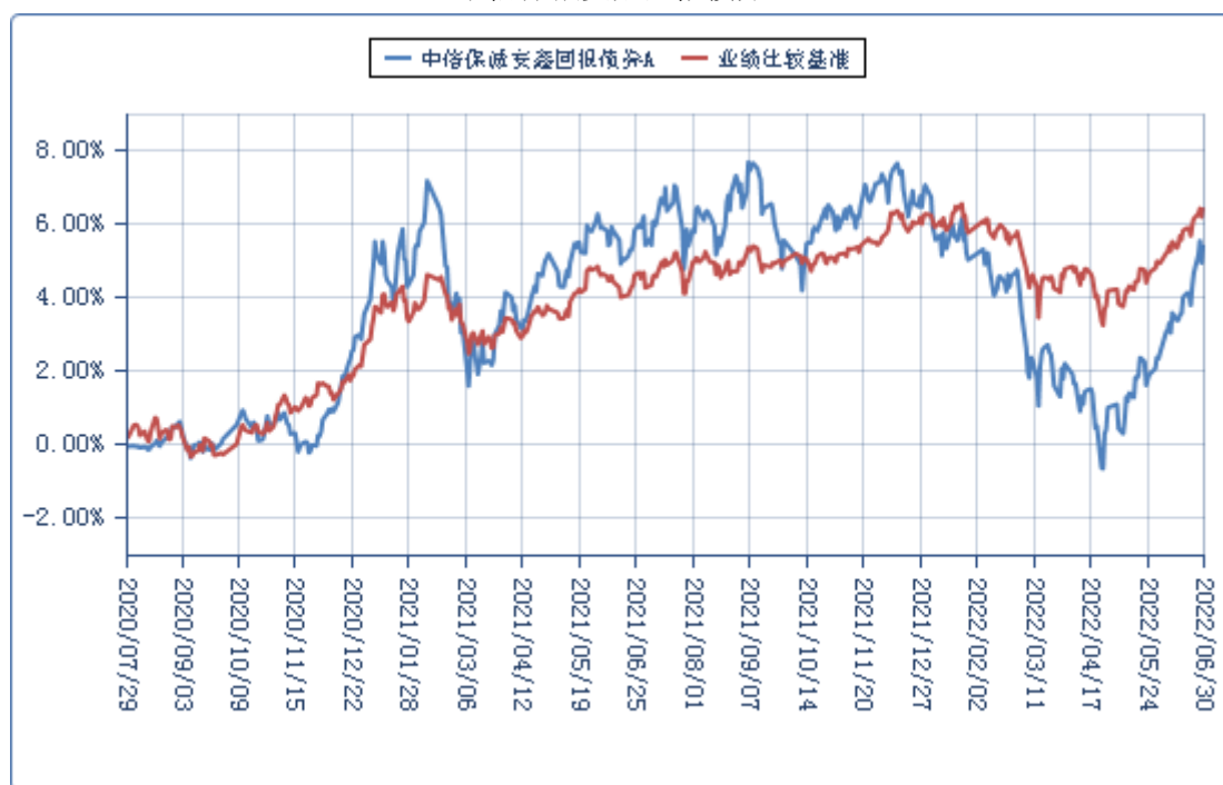
中信保诚安鑫回报债券 C