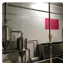
无菌车间 严格消杀 自动机械化分拣