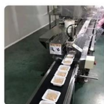
进口器械 高效产出 动态称精准称重