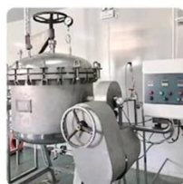
现代化生产模式 行业标准制定单位