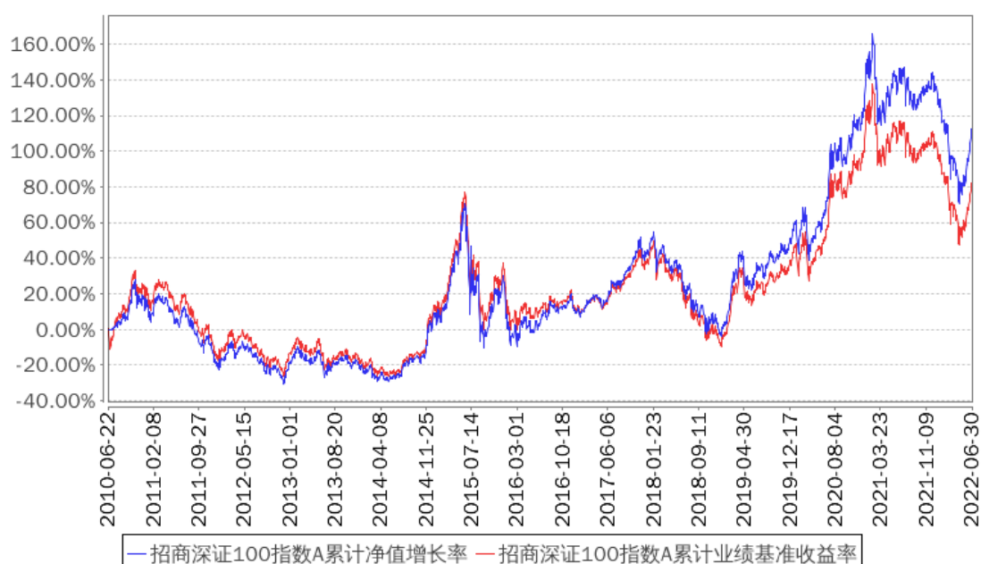
招商深证100指数A累计净值增长率与同期业绩比较基准收益率的历史走势对比图