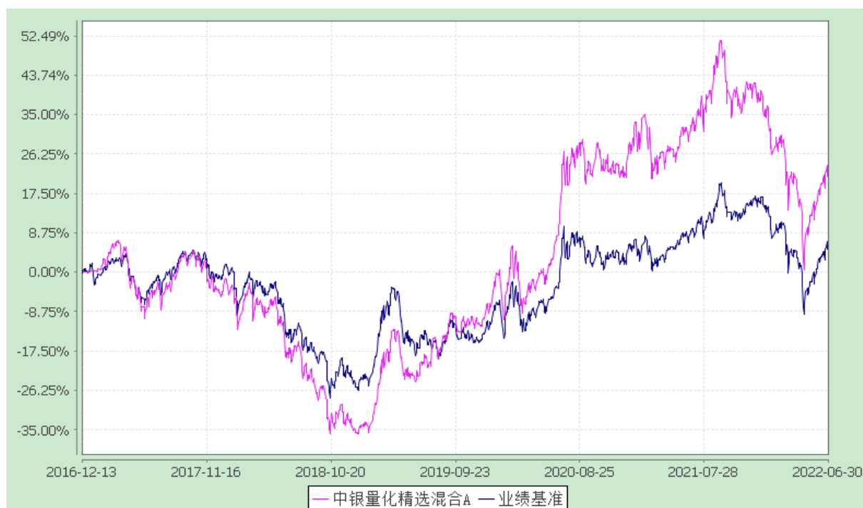
中银量化精选混合 C