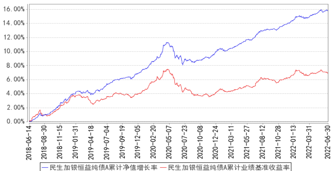
民生加银恒益纯债A 累计净值增长率与同期业绩比较基准收益率的历史走势对比图