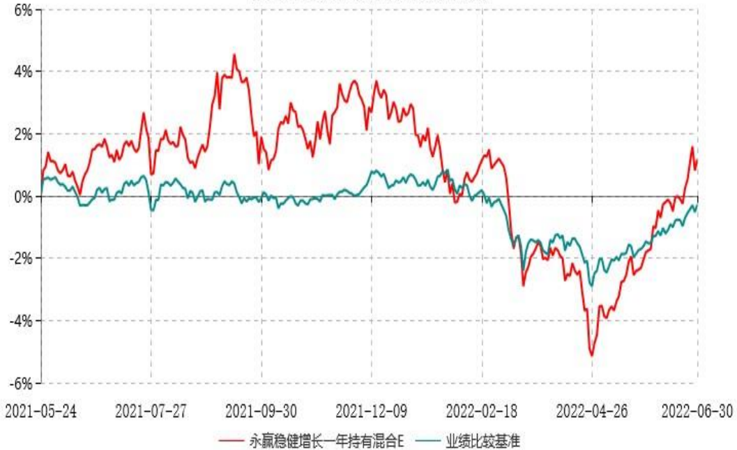
永赢稳健增长一年持有混合E累计净值增长率与业绩比较基准收益率历史走势对比图 (2021年05月24日-2022年06月30日)